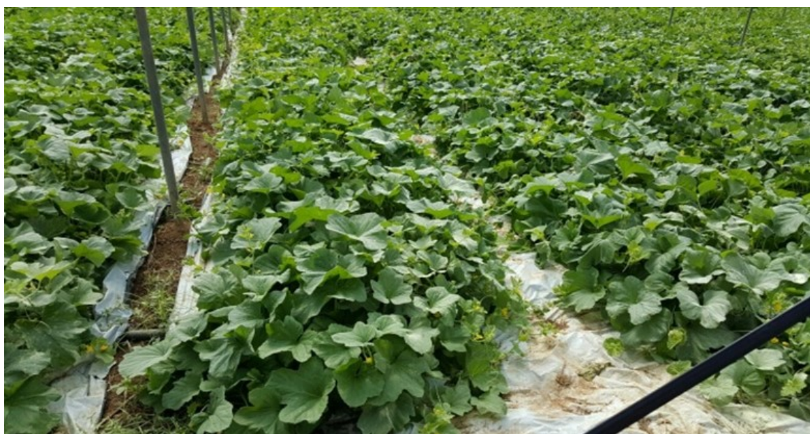
Figura 1- Piante di "Caroselli" in serra trattate con LA-mPAM - Leverano (LE) 07-2016

Visita la sezione “ PROVE COLTURALI ” nella nostra homepage per verificare gli incrementi produttivi che puoi ottenere con “LA-mPAM”