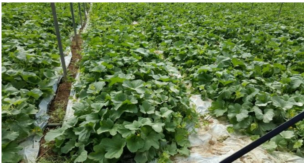
Figura 1 Serra trattata con LA-mPAM - visibile la pacciamatura applicata