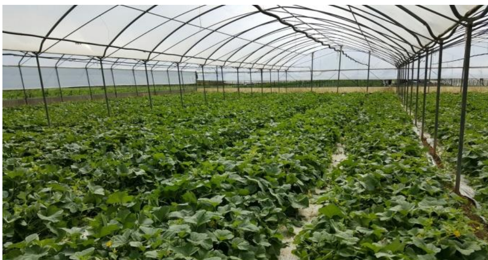
Figura 2 Serra non trattata - Panoramica superficie del modulo